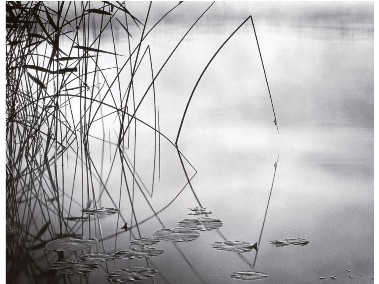
Rechts oben Lily Pads and Tules.