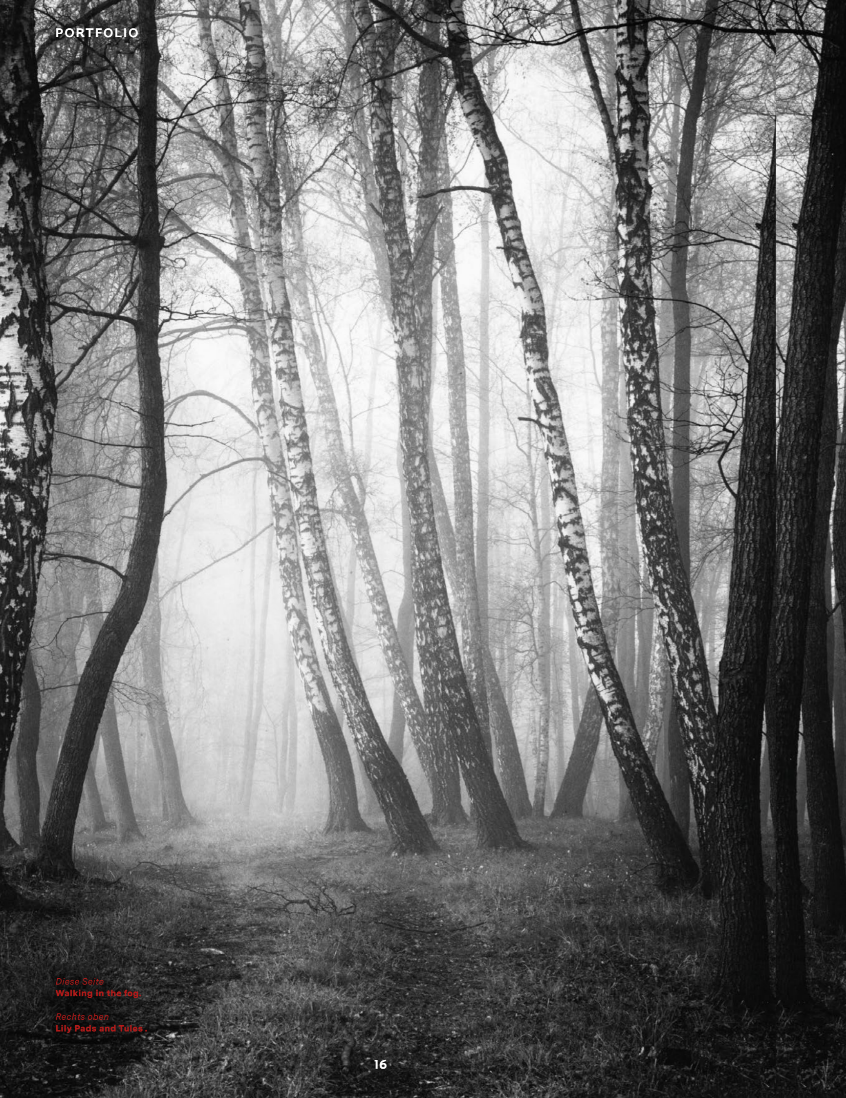
Diese Seite Walking in the fog.